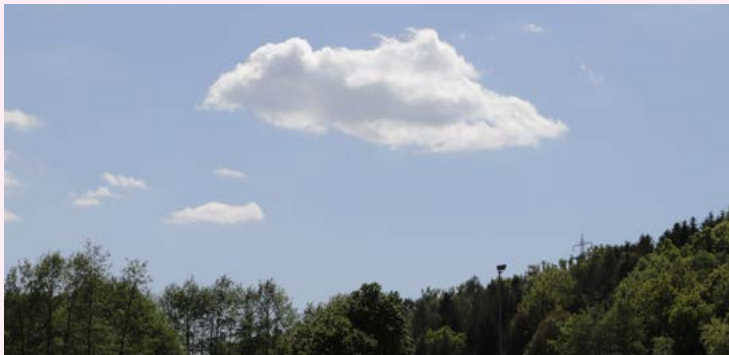
Himmelfahrt am Sportplatz Gläserzell