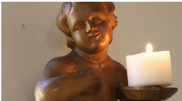
Engel in der Matthäuskirche

Gern können Sie die Termine dem Gemeindebrief in Druckform entnehmen.